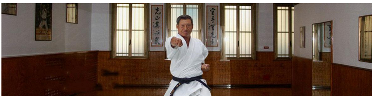
Il Maestro Hiroshi Shirai

Il corso è affiliato alla F.I.K.T.A. , la più importante federazione italiana di Karate tradizionale, diretta dal Maestro Hiroshi Shirai, portatore del Karate Shotokan in Italia e figura di riferimento a livello mondiale nel campo delle arti marziali. Lo Shotokan Karate Ryu PB rappresenta il settore Arti Marziali della Polisportiva Olimpia PB, una Associazione Sportiva Dilettantistica operante sul territorio peschierese da diversi anni e in diversi settori sportivi con significativi risultati.