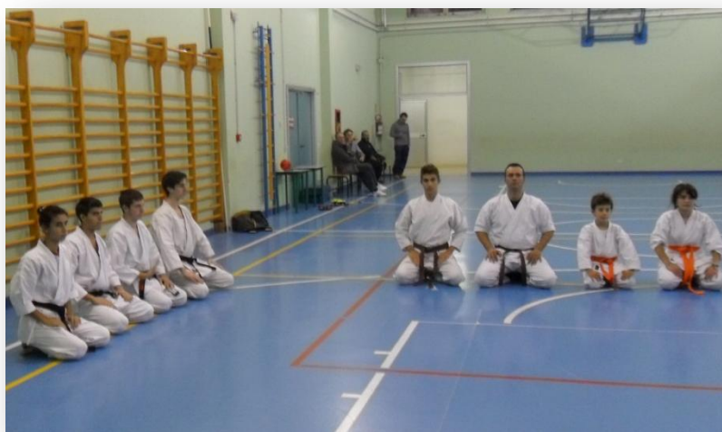
Gli allievi praticano il saluto ad inizio lezione

All'interno del Dojo , il luogo in cui si pratica, è fondamentale l'osservanza di una serie di regole e di una precisa etichetta riguardante il rapporto con i propri compagni, il Maestro e il Dojo stesso. La lezione inizia e finisce con il saluto ("Rei"), espressione di cortesia e rispetto per l'impegno di tutti durante la pratica.