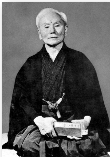
Il Maestro Gichin Funakoshi

Il karate è un'arte marziale che affonda le sue radici in varie forme di combattimento a mani nude sviluppatasi nell'isola di Okinawa. Importato in Giappone all'inizio del 900, il Karate si è progressivamente frazionato in diversi stili, tra i quali lo Shotokan, attualmente il più praticato al mondo. Il fondatore del Karate Shotokan, il Maestro Funakoshi, seppe integrare le tecniche di combattimento di Okinawa con il Bushido, il sistema filosofico basato sull'onore e il rispetto che orientava la vita di un samurai. Quest'incontro portò alla nascita di un'arte capace di coniugare l'originaria finalità di autodifesa della pratica con la necessità di conservare e trasmettere una serie di valori legati a una realtà destinata a soccombere di fronte all'affermarsi della cultura occidentale. Il Karate si affermò come un vero e proprio sistema di crescita personale, coinvolgendo tutti gli aspetti dell'essere umano: corpo, mente e spirito. Iniziò a diffondersi al punto da essere adottato nei programmi di educazione fisica nelle scuole pubbliche e a diventare parte del patrimonio culturale giapponese, fino all'affermazione a livello mondiale. In Italia il Karate Shotokan giunse negli anni '60 grazie al lavoro del maestro Hiroshi Shirai, inviato nel nostro Paese dalla Japan Karate Association. Le straordinarie potenzialità di questa disciplina come strumento di sviluppo educativo e psicofisico permisero la sua diffusione a livello nazionale.